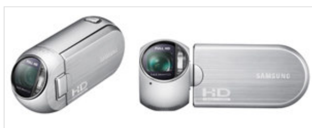
Foto Videokamera Samsung HMX-R10